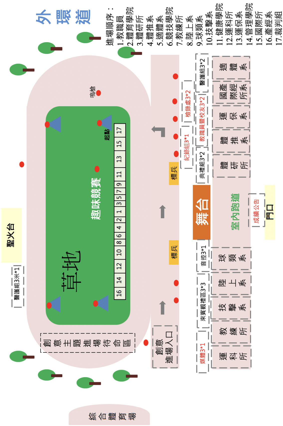
31週年校慶暨運動會場地配置圖【田徑場】